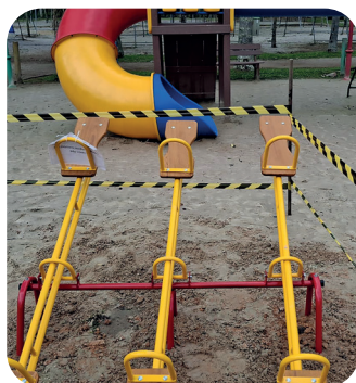
NOVAS AQUISIÇÕES NO PARQUINHO