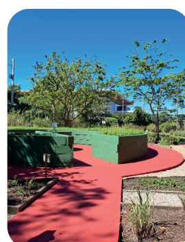
REVITALIZAÇÃO DOS ACESSOS