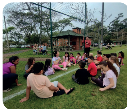
DIA DAS CRIANÇAS