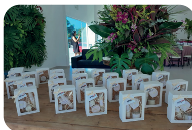
DIA DAS MÃES