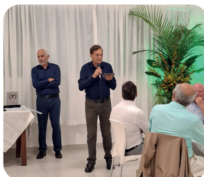
1º Prêmio AFFESC AMBIENTAL