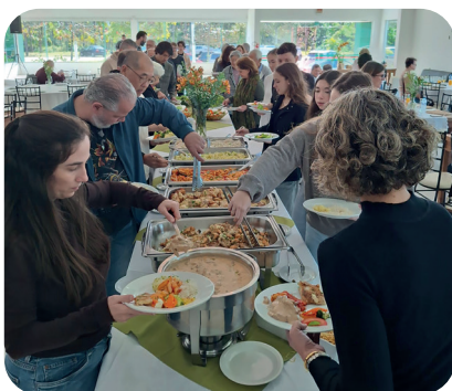
DIA DOS PAIS